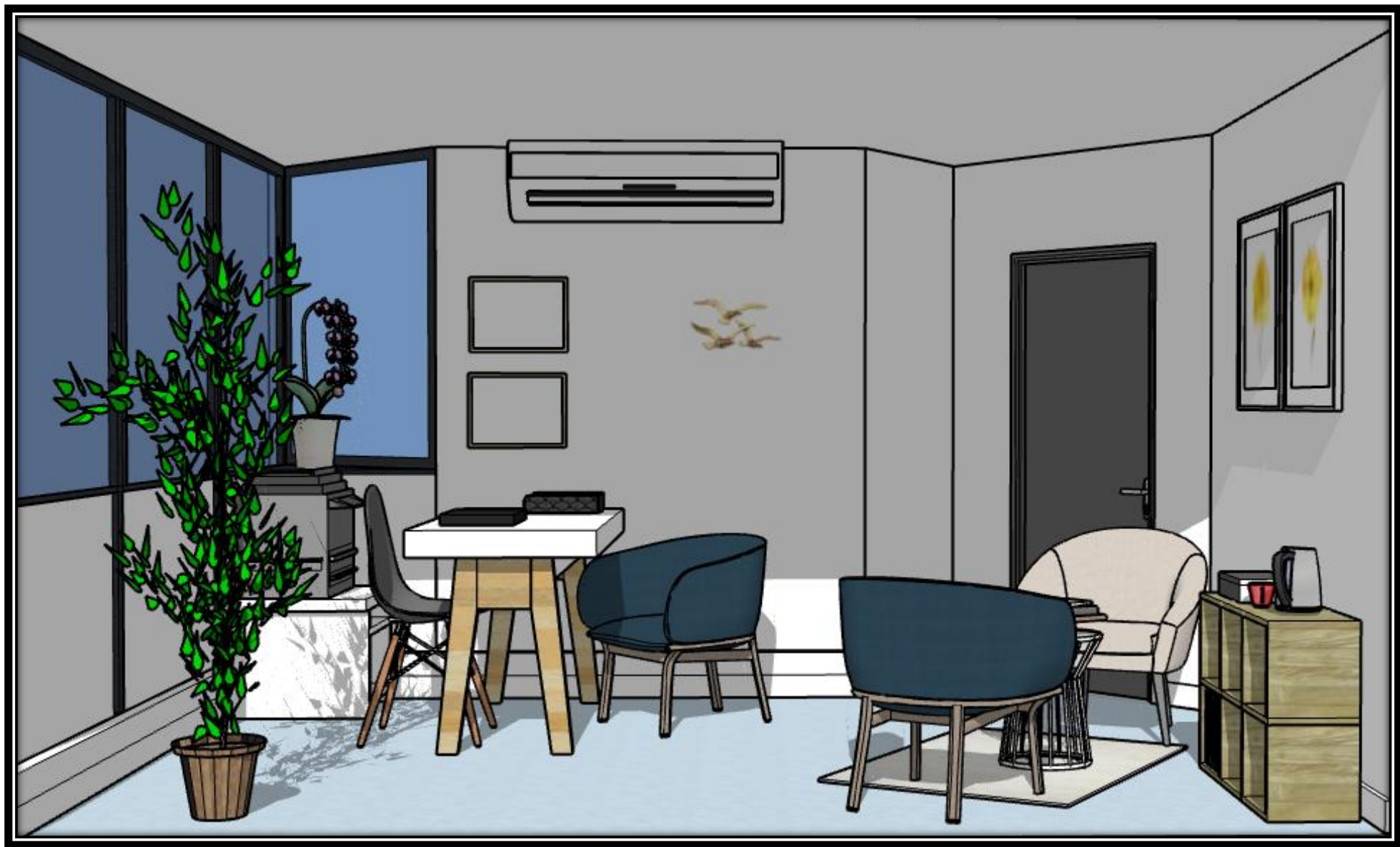
Proposition d'aménagement retenue