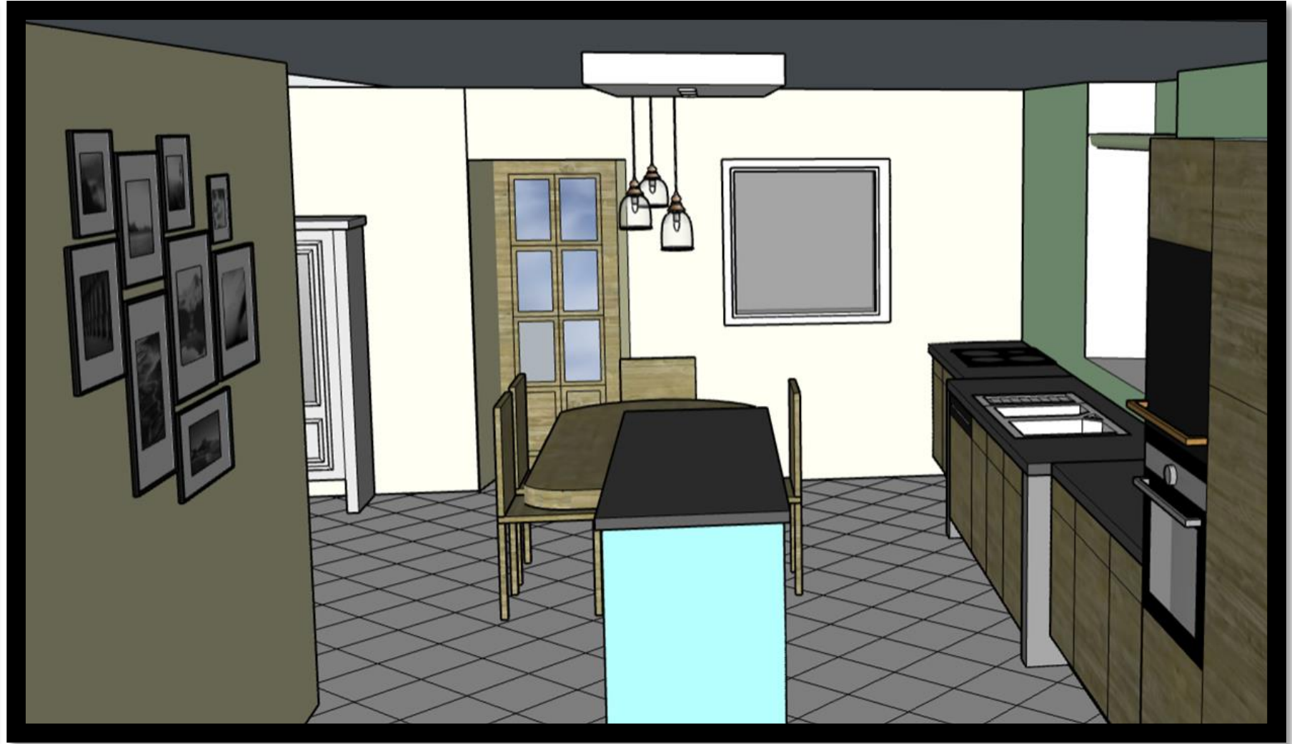
Vue de la porte de la l'arrière cuisine