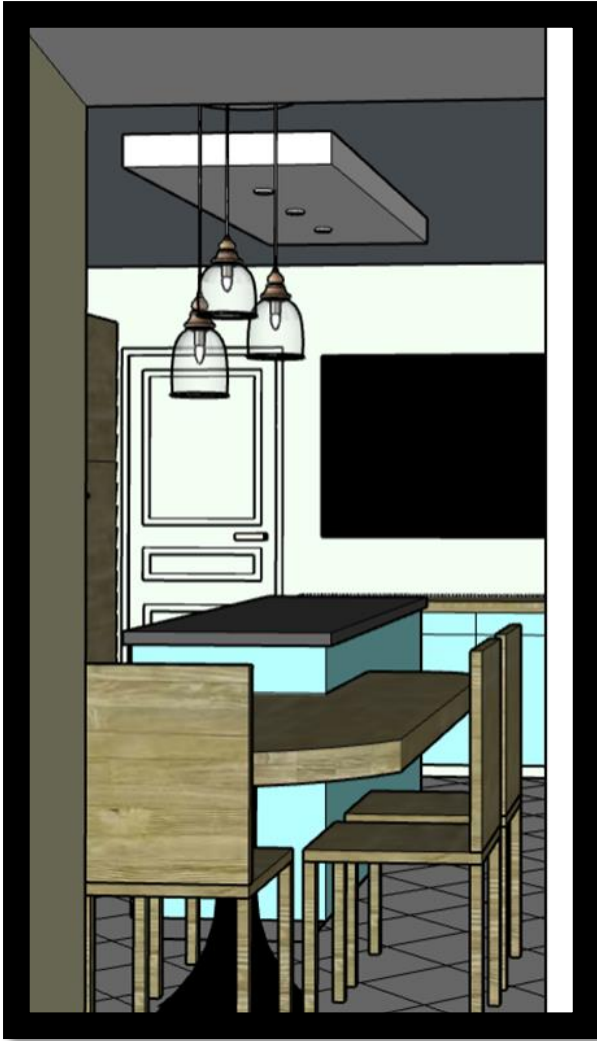
Vue de la porte de la cuisine